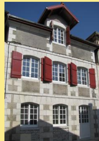
Exemple de maison rénovée respectant l'esprit de l'AVAP et du patrimoine bidachot

Des points particuliers sont définis pour chacun des 4 secteurs. En dehors de ces secteurs, il existe une charte de protection des paysages. Ces documents sont disponibles www.bidache.fr (Village/Info/Mairie).